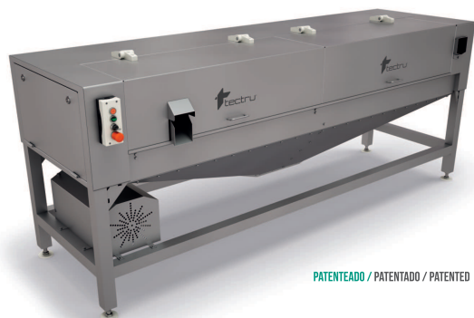
PATENTEADO / PATENTADO / PATENTED